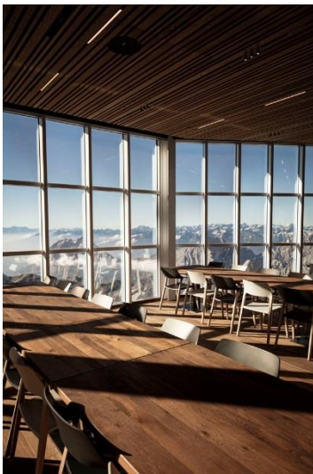
Bild 4: Mit dem Abschluss der Arbeiten am Panorama 2962 weisen ab morgen Lichtlösungen von Zumtobel den Weg vom Tal bis zur Bergstation und weiter bis hinauf zum Gipfelrestaurant des höchsten Berges Deutschlands. © Zumtobel/Matthias Fend

Bild 3: Für angenehmes Licht im Restaurant wurde SUPERSYSTEM II von Zumtobel ausgewählt. Die Lichtschienen wurden in die abgehängten Decken eingebaut. Die LED-Miniaturstrahler lassen dem Restaurantbetreiber fortan die nötige Flexibilität, die jeweils passende Lichtstimmung zu gestalten. © Zumtobel/Matthias Fend