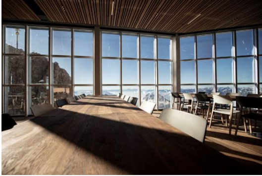
Bild 3: Für angenehmes Licht im Restaurant wurde SUPERSYSTEM II von Zumtobel ausgewählt. Die Lichtschienen wurden in die abgehängten Decken eingebaut. Die LED-Miniaturstrahler lassen dem Restaurantbetreiber fortan die nötige Flexibilität, die jeweils passende Lichtstimmung zu gestalten.